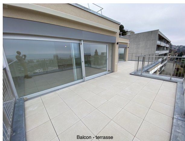
Balcon - terrasse

Nous nous tenons volontiers à votre disposition pour vous donner de plus amples renseignements et/ou afin d'organiser une visite de cet objet locatif ; nous rappelons que notre formulaire de demande de location doit être impérativement rempli et accompagné de l'ensemble des documents usuels.