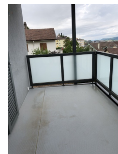
Balcon - terrasse