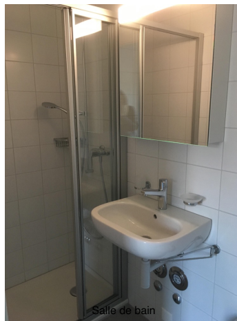
Salie de bain