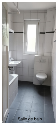
Salle de bain