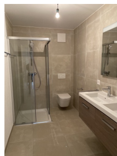
Salle de bain