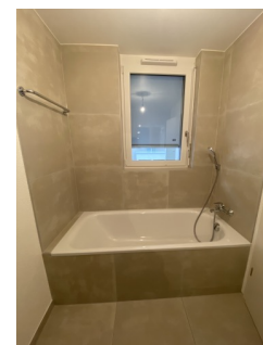
Salle de bain