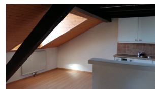
Cuisine Salle de bain