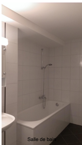
Salle de bain