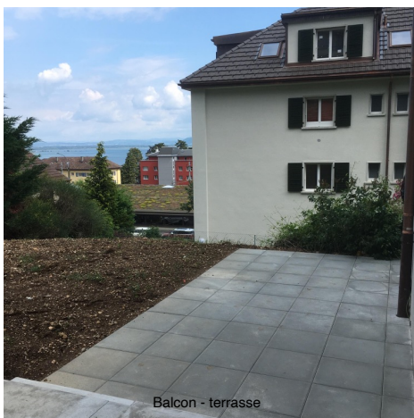
Balcon - terrasse