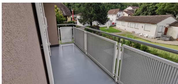
Balcon - terrasse

Nous nous tenons volontiers à votre disposition pour vous donner de plus amples renseignements et/ou afin d'organiser une visite de cet objet locatif ; nous rappelons que notre formulaire de demande de location doit être impérativement rempli et accompagné de l'ensemble des documents usuels.