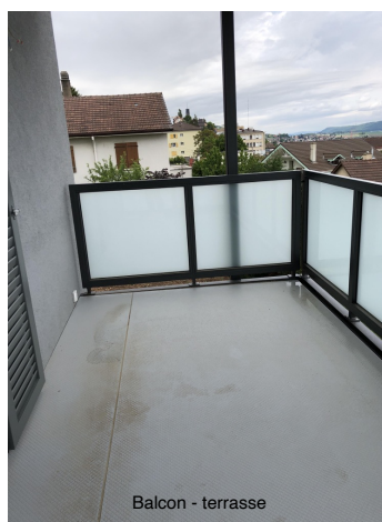
Balcon - terrasse

Nous nous permettons de rappeler que notre formulaire (demande de location pour un objet d'habitation/ téléchargeable depuis notre site Internet / rvksa.ch) doit nous être adressé impérativement rempli. Une fois le dossier avalisé préalablement par le(s) bailleur(s), l'ensemble des documents usuels et sollicités par le formulaire. Un délai raisonnable et convenable, dans le cadre d'une mise en location, sera concédé pour y procéder. À défaut, une autre candidature