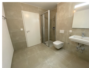
Salle de bain