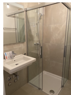
Salle de bain