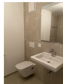
Salle de bain