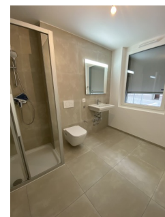
Salle de bain